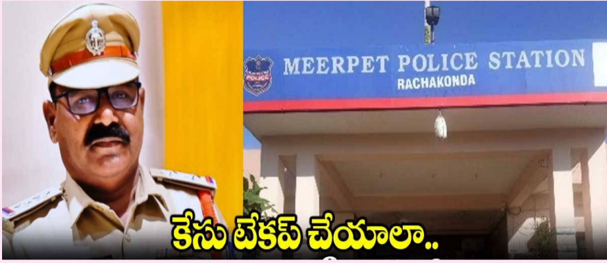
కేసు టేకప్ చేయాలా..