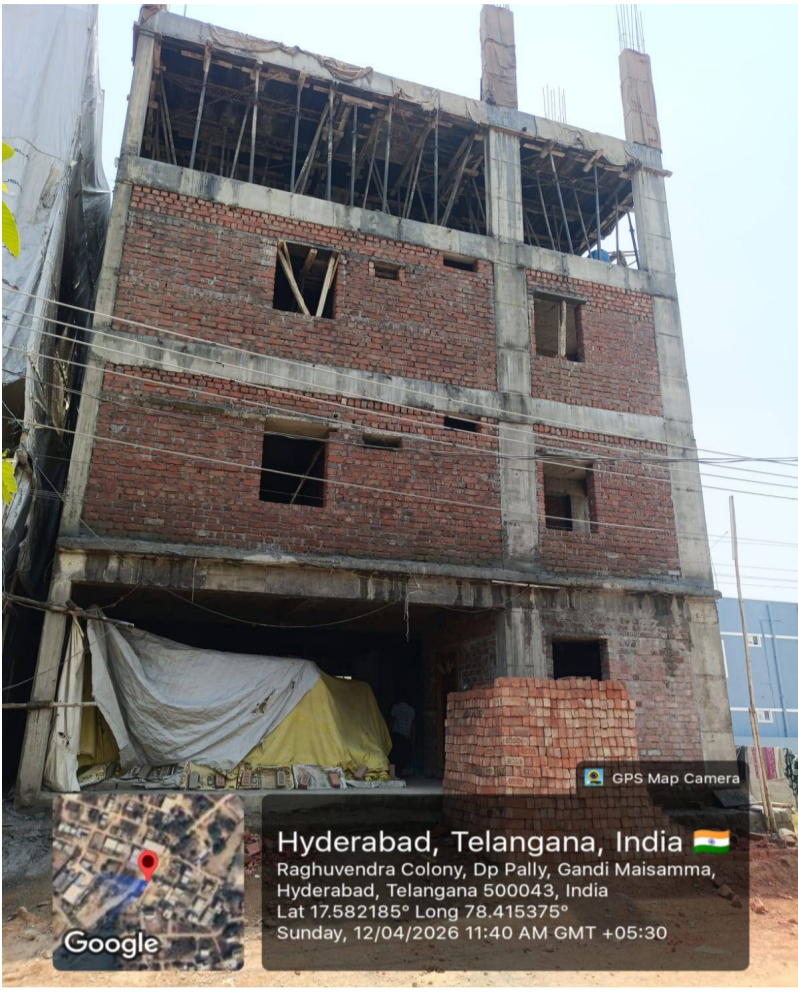
Hyderabad, Telangana, India Raghuvendra Colony, Dp Pally, Gandhi Maisamma, Hyderabad, Telangana 500043, India Lat 17.582185° Long 78.415375° Sunday, 12/04/2026 11:40 AM GMT +05:30

నింపుకుంటున్నారని స్థానిక ప్రజలు బాహటంగా చర్చించుకుంటున్నారు! వేటు పడినా తీరు మారదా?:అవినీతికి పాల్పడుతున్నారనే ఆధారాలు దొరకడంతో టౌన్ ప్లానింగ్ అధికారిపై వేటు వేసి అవినీతి అభియోగంపై కింది స్థాయి సిబ్బందిని ఇతర శాఖల్లోకి బదిలీ చేశారు. దీంతో ఇక దుండిగల్ సర్కిల్ లో అధికారులు, సిబ్బంది కొంతమేరకైనా పారదర్శకంగా పని చేస్తారని ఆశించినా నూతనంగా బాధ్యతలు చేపట్టిన టౌన్ ప్లానింగ్ అధికారులు, చైన్ మెన్ లు సైతం తమ దారి రహదారే అన్నట్టుగా అక్రమ నిర్మాణాలకు అండగా వుంటున్నారు. ఇప్పటికైనా జోనల్ కమిషనర్, ఉన్నతధికారులు స్పందించి అక్రమ నిర్మాణంపై చర్యలు తీసుకొని అధికారులు, సిబ్బందిపై ఓ కన్నేసి ఉంచాలని స్థానికులు కోరుతున్నారు.