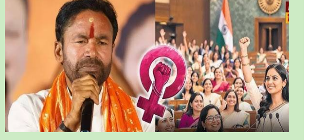
70 శాతం ఆదాయం వస్తుంది. మిగిలిన జిల్లాలకు కోతపెట్టి గ్రేటర్ ? జిల్లాలో సీట్లు పెంచాలని రేవంత్, అసదుద్దీన్, కేటీఆర్ కోరుతున్నారని, మిగిలిన జిల్లాల్లో సీట్లు పెరగాల్సిన

రేవంత్ రెడ్డి ఇచ్చిన హైలైట్ ఫార్మాటా మజ్లిస్ పార్టీ తయారు చేసిందని కేంద్ర మంత్రి కిషన్ రెడ్డి విమర్శించారు. అసదుద్దీన్ షాద్ మెంట్ లో రేవంత్ రెడ్డి ఫార్మాటాను ప్రకటించాడని మండిపడ్డారు. శుక్రవారం ఢిల్లీలోని తన నివాసంలో మీడియాతో మాట్లాడుతూ.. మొదటి నుంచి మహిళలకు ఎటువంటి రిజర్వేషన్లు ఉండొద్దనేది మజ్లిస్ పార్టీ కుట్ర చేస్తుందని, మహిళలు రాజకీయాల్లోకి వస్తే కొత్త సమస్యలు వస్తాయని మజ్లిస్ నాయకులు, అక్బరుద్దీన్ ఓవైసీ మాట్లాడినవి అసెంబ్లీ రికార్డులో ఉన్నాయని గుర్తు చేశారు. హైదరాబాద్ లో సీట్ల పునర్విభజన జరిగితే తమ సీట్లకు ఎక్కడ ముప్పువస్తుందో అనే భయంతో కాంగ్రెస్, బీఆర్ఎస్ పార్టీని కలిపి కుట్రలు చేస్తోందన్నారు. మజ్లిస్ పార్టీ ఈ రెండు పార్టీలతో కలిసి చర్చించి పునర్విభజనను, మహిళా రిజర్వేషన్లను వ్యతిరేకంగా ప్రచారం చేస్తోందన్నారు. హైదరాబాద్, రంగారెడ్డి జిల్లాల నుంచి