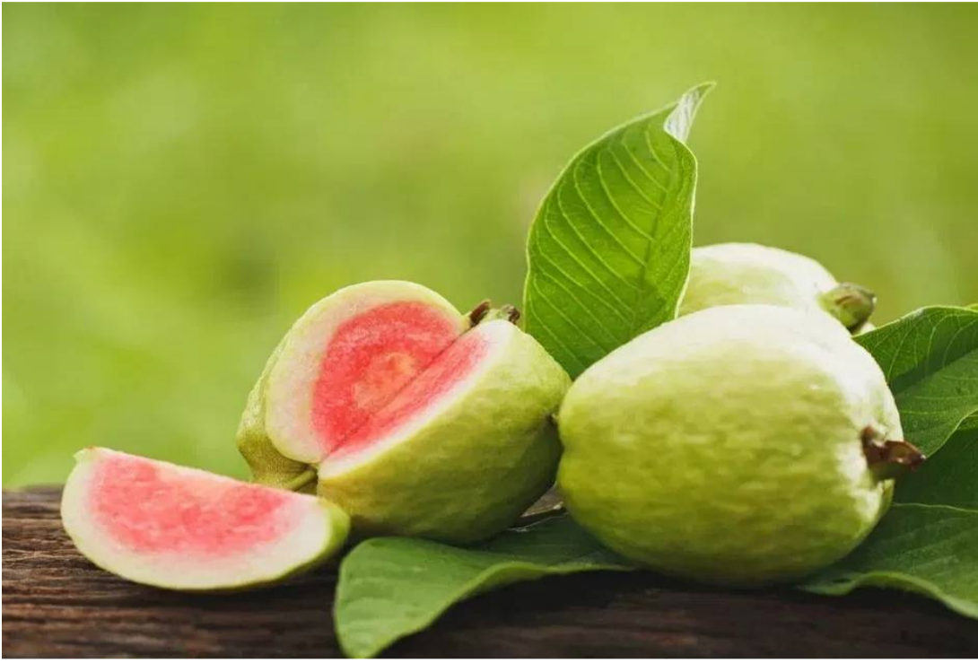
విటమిన్ సి, యాంటీఆక్సిడెంట్లు పుష్కలంగా ఉంటాయి. వృద్ధులు జామను ఆహారంలో చేర్చుకోవడం వల్ల గుండె ఆరోగ్యం మెరుగుపడుతుంది. ఇందులో ఉండే పాలిఫెనాల్స్, ఫ్లేవనాయిడ్లు శరీరంలో వాపులు, మంటును తగ్గిస్తాయి. గుండె సంబంధిత సమస్యలు రాకుండా కాపాడతాయి. మొత్తానికి జామ ఎలా తిన్నా ఆరోగ్యమే..