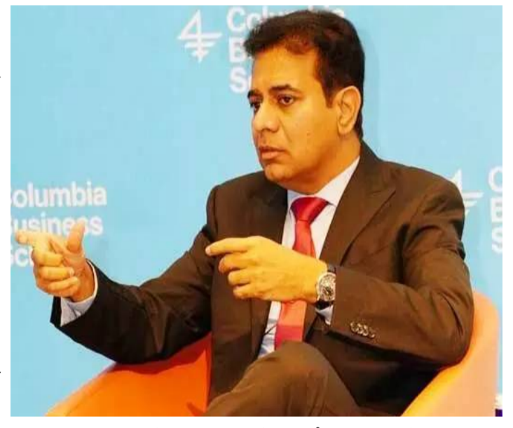
కారణంగానే హైదరాబాద్ గ్లోబల్ ఐటీ డిగ్గజాలకు కేఫ్ అడ్రెస్‌గా మారిందని చెప్పారు. హైదరాబాద్‌లో అమెజాన్ ప్రపంచంలోనే అతిపెద్ద క్యాంపస్‌ను ఏర్పాటు చేసిందని, గూగుల్, ఆపిల్, మెటా, నెట్లీ ఫ్లోర్స్, ఉబంత్, మైక్రోసాఫ్ట్ టెక్నాలజీ వంటి సంస్థలు తమ కీలక కార్యకలాపాలను ఇక్కడ నిర్వహిస్తున్నాయని ఆయన పేర్కొన్నారు. అవిష్కరణలకు చిరునామా తెలంగాణ మారిందన్నారు. ప్రపంచంలోనే అతిపెద్ద మల్టీ పర్పస్ లిఫ్ట్ ఇరిగేషన్ ప్రాజెక్ట్ అయిన 'కాశీశ్రవణ' ద్వారా 45 లక్షల ఎకరాలకు సాగునీరు అందుతోందని వివరించారు.

స్వతంత్ర భారతదేశంలో అత్యంత విజయవంతమైన స్టార్టప్ స్టేట్ తెలంగాణ అని మాజీ మంత్రి, బీఆర్‌ఎస్ వర్కింగ్ మెంబర్ కేటీఆర్ అన్నారు. అమెరికా న్యూయార్క్ నగరంలోని ప్రతిష్టాత్మక కాలంబియా బిజినెస్ స్కూల్‌లో నిర్వహించిన 21వ వార్షిక ఇండియా బిజినెస్ కాన్ఫరెన్స్‌కు కేటీఆర్ ముఖ్య అతిథిగా హాజరై ప్రసంగించారు. ఈ సందర్భంగా విద్యార్థులు, పారిశ్రామికవేత్తలు, అంతర్జాతీయ ఇన్వెస్టర్లను ఉద్దేశించి తెలంగాణ సాధించిన అద్భుత ప్రగతిని వివరించారు. కేటీఆర్ నాయకత్వంలో పరిపాలన, ఆవిష్కరణలు, ఆర్థిక వృద్ధిలో దేశానికే దిక్సూచిగా నిలిచిందన్నారు. తెలంగాణ ప్రస్థానం అంటే అత్యగ్రహణ, ఆకాంక్ష, పురోగతికి నిదర్శనమన్నారు. తాము అవకాశాల కోసం ఎదురుచూడలేదని.. వాటిని అందిచ్చుకునేందుకు అద్భుతమైన పాలసీలను తయారు చేశామని తెలిపారు. తద్వారా పెట్టుబడిదారుల్లో నమ్మకాన్ని కలిగించి వృద్ధిని సాధించామని పేర్కొన్నారు. 2027లో భారత్ 80వ స్వాతంత్ర్య దినోత్సవానికి సిద్ధమవుతున్న వేళ, కేవలం పదేళ్లలోనే తెలంగాణ సాధించిన ఆర్థిక ప్రగతి గర్వకారణమని అన్నారు. రాష్ట్రంలో దేశభివృద్ధికి ఇంజన్లు అన్న భావనను కేటీఆర్ వివరించారు. ఐటీ ఎగుమతులు రూ.57వేల కోట్ల నుండి రూ.2.72 లక్షల కోట్లకు పెరిగాయి.. ఐటీ ఉద్యోగాల సంఖ్య 3.23 లక్షల నుండి దాదాపు 10 లక్షలకు చేరుకున్నదని తెలిపారు. ప్రభుత్వ వేగవంతమైన నిర్ణయాలు, పటిష్టమైన ఎకా సిస్టమ్