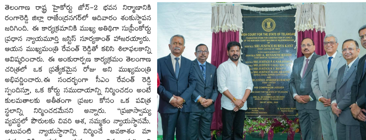
తెలంగాణ రాష్ట్ర హైకోర్టు జోన్-2 భవన నిర్మాణానికి రంగారెడ్డి జిల్లా రాజేంద్రనగర్‌లో ఆదివారం శంకుస్థాపన జరిగింది. ఈ కార్యక్రమానికి ముఖ్య అతిథిగా సుప్రీంకోర్టు ప్రధాన న్యాయమూర్తి జస్టిస్ సూర్యకాంత్ హాజరయ్యారు. ఆయన ముఖ్యమంత్రి రేవంత్ రెడ్డితో కలిసి శిలాఫలకాన్ని ఆవిష్కరించారు. ఈ అంకురార్పణ కార్యక్రమం తెలంగాణ చరిత్రలో ఒక ప్రత్యేకమైన రోజు అని ముఖ్యమంత్రి అభివర్ణించారు. ఈ సందర్భంగా సీఎం రేవంత్ రెడ్డి స్పందిస్తూ, ఒక కోర్టు సముదాయాన్ని నిర్మించడం అంటే కులమతాలకు అతీతంగా ప్రజల కోసం ఒక పవిత్ర స్థలాన్ని నిర్మించడమే అన్నారు. “ప్రజాస్వామ్య వ్యవస్థలో పౌరులకు చివరి ఆశ, నమ్మకం న్యాయస్థానమే. అటువంటి న్యాయస్థానాన్ని నిర్మించే అవకాశం మా ప్రభుత్వానికి రావడం అదృష్టంగా భావిస్తున్నాను” అని ఆయన పేర్కొన్నారు. ఈ కొత్త హైకోర్టు భవనం ప్రజాస్వామ్యానికి ఒక ప్రతీకగా నిలుస్తుందని, న్యాయం కోసం వచ్చి పేదరు, బలహీనులకు భరోసా ఇస్తుందని ఆయన విశ్వాసం వ్యక్తం చేశారు. 2027 డిసెంబర్ నాటికి ఈ భవన నిర్మాణాన్ని పూర్తి చేయాలని లక్ష్యంగా పెట్టుకున్నట్లు సీఎం స్పష్టం చేశారు. ఈ శంకుస్థాపన కార్యక్రమంలో సుప్రీంకోర్టు

రాష్ట్రవ్యాప్తంగా సాగునీటి వనరుల సంరక్షణ, రబీ పంటల రక్షణకు తక్షణ చర్యలు చేపట్టాలని రాష్ట్ర నీటి పారుదల శాఖ మంత్రి ఉత్తమకుమార్‌రెడ్డి ఉన్నతాధికారులను ఆదేశించారు. రబీ సీజన్ చివరి దశలో ఉన్న పంటలకు చివరి వరకూ నీరందేలా చర్యలు తీసుకోవాలని స్పష్టం చేశారు. ఆదివారం మంత్రి ఉన్నతాధికారులతో అత్యవసర ఉన్నతస్థాయి సమీక్ష నిర్వహించారు. ఈ సందర్భంగా మాట్లాడుతూ.. అందుబాటులో ఉన్న నీటిని వినియోగించడంతోపాటు రాష్ట్రంలోని అన్ని ప్రధాన, మధ్య తరహా ప్రాజెక్టులు, చెరువుల్లో సముగ్ర డీసీల్‌షెన్, డీసెడిమెంటేషన్ కార్యక్రమాలు చేపట్టాలని ఆదేశించారు. లభ్యమయ్యే నీటిని సమర్థంగా వినియోగించడంలో చీఫ్ ఇంజనీర్లు బాధ్యత వహించాల్సి ఉంటుందని ఆదేశించారు. నిల్వ ఉన్న పంటలు ఎండిపోకుండా కాపాడటం, తాగునీటి అవసరాలకు తగిన నిల్వలను సంరక్షించడం రెండు ప్రధాన ప్రాధాన్యతలుగా తీసుకోవాలని పేర్కొన్నారు. అధికారులు స్వయంగా ముందుండి పరిస్థితులను అంచనా వేసి తక్షణ నిర్ణయాలు తీసుకోవాలని సూచించారు. నాగార్జునసాగర్ ఎడమ కాల్వ పరిధిలోని 6.30 లక్ష ఎకరాల ఆయకట్టులో ఇప్పటికే రబీ సీజన్లో పంటలకు సాగునీరు అందించామని అధికారులు తెలిపారు. కోతలు పూర్తయిన ప్రాంతాలను మినహాయించి ఇంకా తడి అవసరమైన పంటలకు తప్పనిసరిగా నీరు అందించాలని మంత్రి ఆదేశించారు. కాల్వలు, మూసీ ముందు తాగునీటి అవసరాల కోసం చెరువులు, ట్యాంకులు పూర్తిగా నింపాలని అధికారులను ఆదేశించారు.