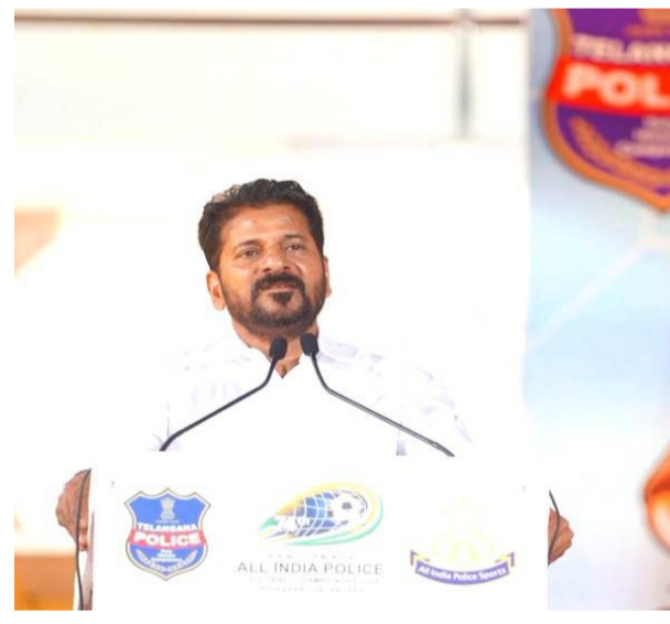
ఒకప్పుడు పుట్ బాల్ కు హైదరాబాద్ సెంటర్ గా ఉండేదన్నార సీఎం రేవంత్ రెడ్డి. 1950 నుంచి 1970 మధ్య కాలంలో హైదరాబాద్ పోలీస్ టీమ్ ఏకంగా 16 మెడల్స్ సాధించిందని ఆయన కొనియాడారు. దేశానికి ఎంతో మంది అగ్రశ్రేణి స్టేయర్లను అందించిన ఘనత మన నగరానిదేనని స్పష్టం చేశారు. హైదరాబాద్ వేదికగా జరిగిన ఆలిండియా పోలీస్ పుట్ బాల్ పోటీలు ముగిశాయి.

జూరాల ప్రాజెక్టు మరమ్మత్తులు యుద్ధ ప్రాతిపదికన పూర్తిచేయాలని మంత్రి ఆదేశించారు. ప్రస్తుతం ప్రాజెక్టులో 1.66 డీఎంసీల నీరు నిల్వ ఉండగా, నారాయణపూర్ నుంచి పునరుత్పత్తి నీటిగా 0.5 డీఎంసీలు చేరే అవకాశం ఉన్నదని అధికారులు తెలిపారు. ప్రవాహాలు అలస్యమైతే 0.5 డీఎంసీల లోటు ఎర్పడే అవకాశం ఉన్నదని చెప్పారు.