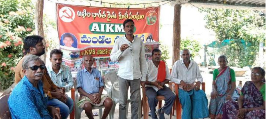
ఎదుర్కొంటున్నారని ఈ సమస్యలను తక్షణమే పరిష్కరించాలని ఆయన కోరారు.ఇప్పటికే రైతులు పండించిన పంటలు మొత్తం కూడా తడిసి మార్కెట్లో నిలువ చేసుకొని అమ్ముకోవడం బయట దళాలకు అమ్ముకోవాల్సిన పరిస్థితి గవర్నమెంట్ ఏ కల్పిస్తుందని కొనుగోలు కేంద్రాలు లేవని, గిట్టుబాటు ధర లేదని, కొనే నాధుడే లేకుండా దళాలను పెంచి పోషిస్తున్నారని వారు అన్నారు.తక్షణమే రైతాంగ సమస్యలను పరిష్కరించాలని ఆయన కోరారు.