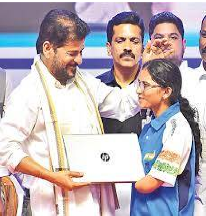
విద్యార్థుల్లో నైపుణ్యాలు గుర్తించే టీచర్లను సత్కరిస్తూ..

రానున్న కాలంలో కేటాయిస్తాం మా ప్రభుత్వ తొలి ప్రాధాన్యం విద్యే డ్రాపవుట్స్ తగ్గించేందుకు పాఠశాలల్లో ఇంటర్ విద్యా వారోత్సవాల ప్రారంభం సందర్భంగా సీఎం రేవంత్ రెడ్డి