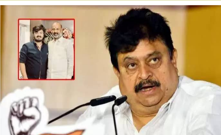
కార్యకర్తలతో కలిసి ఈ సభలో అపారమైన ఉత్సాహంతో పాల్గొన్నారని తెలిపారు. ఈ కార్యక్రమానికి తరలివచ్చిన అశేష జనసమూహం, అక్కడ వెల్లివిరిసిన ఉత్సాహం, మోడీ నాయకత్వంపై, అలాగే 'వికసిత తెలంగాణ - వికసిత భారతదేశం' అనే దార్శనికతపై ప్రజలలో పెరుగుతున్న ఆసక్తిని విశ్వాసానికి నజీవ్ నిదర్శనంగా నిలిచిందని రామచందర్ రావు అన్నారు.