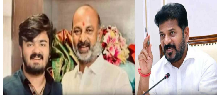
అయినట్లు వెల్లడించారు డీజీపీ. ఈ కేసులో సమగ్ర విచారణ జరిపేందుకు, విచారణ కోసం ప్రత్యేక టీంలను ఏర్పాటు చేయాలని డీజీపీని ఆదేశించారు సీఎం రేవంత్ రెడ్డి. కేసులో పక్కపాత డోరణి లేకుండా విచారణ చేయాలని.. బాధితులకు న్యాయం జరగాలని సూచించారు సీఎం రేవంత్ రెడ్డి.

కేంద్ర హోం శాఖ సహాయ మంత్రి బండి సంజయ్ కుమారుడు భగీరథ్ పై నమోదు అయిన పోక్సో కేసుపై సమగ్ర విచారణకు ప్రభుత్వం ముందడుగు వేసింది. ఈ కేసులో సమగ్ర విచారణ కోసం ప్రత్యేక టీం ఏర్పాటు చేయాలని సీఎం రేవంత్ రెడ్డి ఆదేశించారు. 2026, మే 11వ తేదీ ఈ మేరకు రాష్ట్ర డీజీపీని ఆదేశించారు సీఎం రేవంత్ రెడ్డి. హైదరాబాద్ సిటీలోని షేట్ ఐసీఐఐఐలోని పోలీస్ స్టేషన్ లో బీజేపీ సీనియర్ నేత, కేంద్ర హోం శాఖ సహాయ మంత్రి బండి సంజయ్ కుమారుడు భగీరథ్ పై పోక్సో కేసు నమోదు అయ్యింది. 17 ఏళ్ల బాలికుడై లైంగిక వేధింపులకు పాల్పడినట్లు బాధిత కుటుంబం కంప్లయింట్ చేసింది. మే 8వ తేదీన కంప్లయింట్ చేస్తే.. ఇప్పటి వరకు ఎందుకు చర్యలు తీసుకోలేదని డీజీపీ సీఎం రేవంత్ ను ప్రశ్నించారు సీఎం రేవంత్ రెడ్డి. ప్రధాని మోడీ పర్యటన, భద్రతా ఏర్పాట్లలో సిబ్బంది బీజేపీ ఉండటంతో అలసత్వం