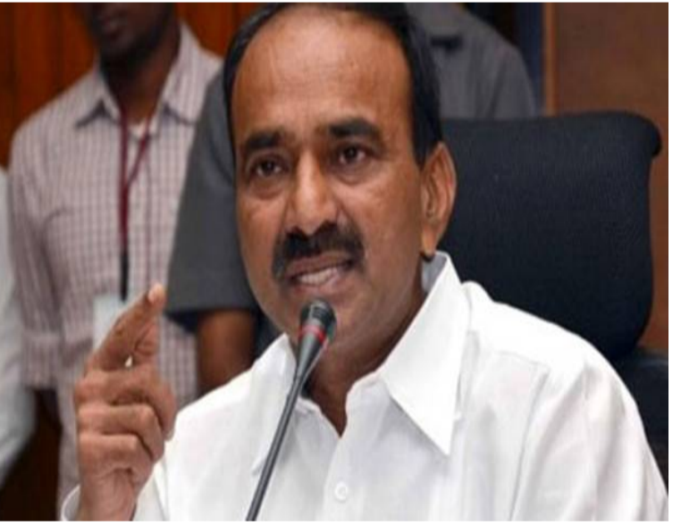
తమిళనాడు ఫలితాలు ఒక హెచ్చరిక అని పేర్కొన్నారు. అవినీతి సామ్యంతో ఎన్నికల్లో గెలవాలనుకునే వారికి ఈ ఫలితాలు కనువిప్పు కావాలని... తెలంగాణ బాగుపడాలంటే బీజేపీ అధికారంలోకి రావడమే ఏకైక మార్గమని ఈటల రాజేందర్ స్పష్టం చేశారు.

ముఖ్యమంత్రి రేవంత్ రెడ్డి ఎన్నికలకు ముందు ఇచ్చిన హామీలకు, ప్రస్తుతం ఆయన చేస్తున్న పనులకు ఏమాత్రం పొంతన లేదని బీజేపీ ఎంపీ ఈటల రాజేందర్ విమర్శించారు. గజ్వేల్ లో జరిగిన పార్టీ సమావేశంలో ఆయన మాట్లాడుతూ.. పదవీ విరమణ పొందిన ఉద్యోగులకు ప్రయోజనాలు కల్పించడంలో, విద్యార్థులకు ఫీజు రీయింబర్స్ మెంట్ చెల్లించడంలో ప్రభుత్వం పూర్తిగా విఫలమైందని మండిపడ్డారు. చివరికి న్యాయస్థానాలు జోక్యం చేసుకుని ప్రభుత్వాన్ని ప్రశ్నించే స్థాయికి పరిస్థితి దిగజారిందని ఆయన ఆవేదన వ్యక్తం చేశారు. గ్రామీణ ప్రాంతాల్లో పనులు చేసిన కాంట్రాక్టర్లకు బిల్లులు అందక వారు ఆత్మహత్యలు చేసుకుంటున్నారని, అధికారంలోకి వచ్చిన రెండేళ్లకే కాంగ్రెస్ పార్టీ ప్రజల చేత ఫిర్యాదులకు స్పందించే స్థితికి చేరుకుందని దృఢపెట్టారు. పశ్చిమ బెంగాల్ లో మమతా బెనర్జీ అహంకారానికి ప్రజలు ఓటుతో బుద్ధి చెప్పారని, తమిళనాడులో స్టాలిన్ వంటి బలమైన నేతపై ఒక సామాన్యుడు గెలిచాడంటే అక్కడి ప్రభుత్వాలపై ఎంత వ్యతిరేకత ఉందో ఆర్ధమవుతుందని విశ్లేషించారు. కుటుంబ రాజకీయాలు చేస్తూ, రాష్ట్రాన్ని తమ జాగీరుగా భావించే వారికి