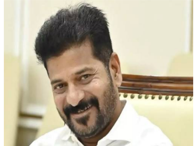
పర్యటనలో కేరళ రాజకీయ సమీకరణాలపై కూడా చర్చ జరిగే అవకాశం ఉంది.

తెలంగాణ ముఖ్యమంత్రి రేవంత్ రెడ్డి రేపు ఉదయం ఢిల్లీ పర్యటనకు వెళ్తున్నారు. ఈ పర్యటనలో ప్రధానంగా హైదరాబాద్ మెట్రో ఫేజ్-2 ప్రాజెక్టుకు అవసరమైన కేంద్ర అనుమతులపై ఆయన దృష్టి సారించనున్నట్లు సమాచారం. ఢిల్లీలో పలువురు కేంద్ర మంత్రులతో భేటీ అయి, రాష్ట్ర అభివృద్ధికి సంబంధించిన పెండింగ్ ప్రాజెక్టులు, సంక్షేమ పథకాలకు అందాల్సిన నిధులపై విజ్ఞప్తులు చేయనున్నారు. పాలనాపరమైన అంశాలతో పాటు, ఏబిసీ అగ్రనేతలతో కూడా ముఖ్యమంత్రి సమావేశం కాలోతున్నారు. కేరళ అసెంబ్లీ ఎన్నికల్లో కాంగ్రెస్ నేతృత్వంలోని యూడీఎఫ్ సాధించిన అఖండ విజయం ఈ పర్యటనకు మరింత ప్రాధాన్యతను చేకూర్చింది. కేరళ ఎన్నికల ప్రచారంలో రేవంత్ రెడ్డి కీలక పాత్ర పోషించి, కూటమి విజయంలో తనవంతు కృషి చేశారు. ప్రస్తుతం కేరళ ముఖ్యమంత్రి ఎవరనే ఉత్సాహం కొనసాగుతుండగా, ఏబిసీ ప్రధాన కార్యదర్శి కేసీ వేణుగోపాల్ పేరు రేసులో బలంగా వినిపిస్తోంది. రేవంత్ రెడ్డికి, పర్యటనలో కేరళ రాజకీయ సమీకరణాలపై కూడా చర్చ జరిగే వేణుగోపాల్ తో ఉన్న సన్నిహిత సంబంధాల నేపథ్యంలో, ఈ ఢిల్లీ