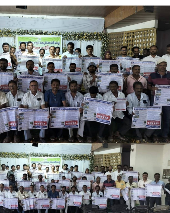
Shot on OnePlus 5 May 2026 at 16:44