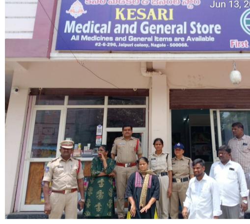
డెకాయ్ ఆపరేషన్లో బట్టబయలు.. ఇద్దరి ఆరెస్టు.. కోర్టుకు తరలింపు..